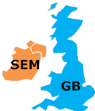
Obrázek 7: Nabídkové zóny Single Electricity Market Ireland a Velká Británie

Zeměpisný přehled vymezení nabídkové zóny je uveden na následujícím obrázku: